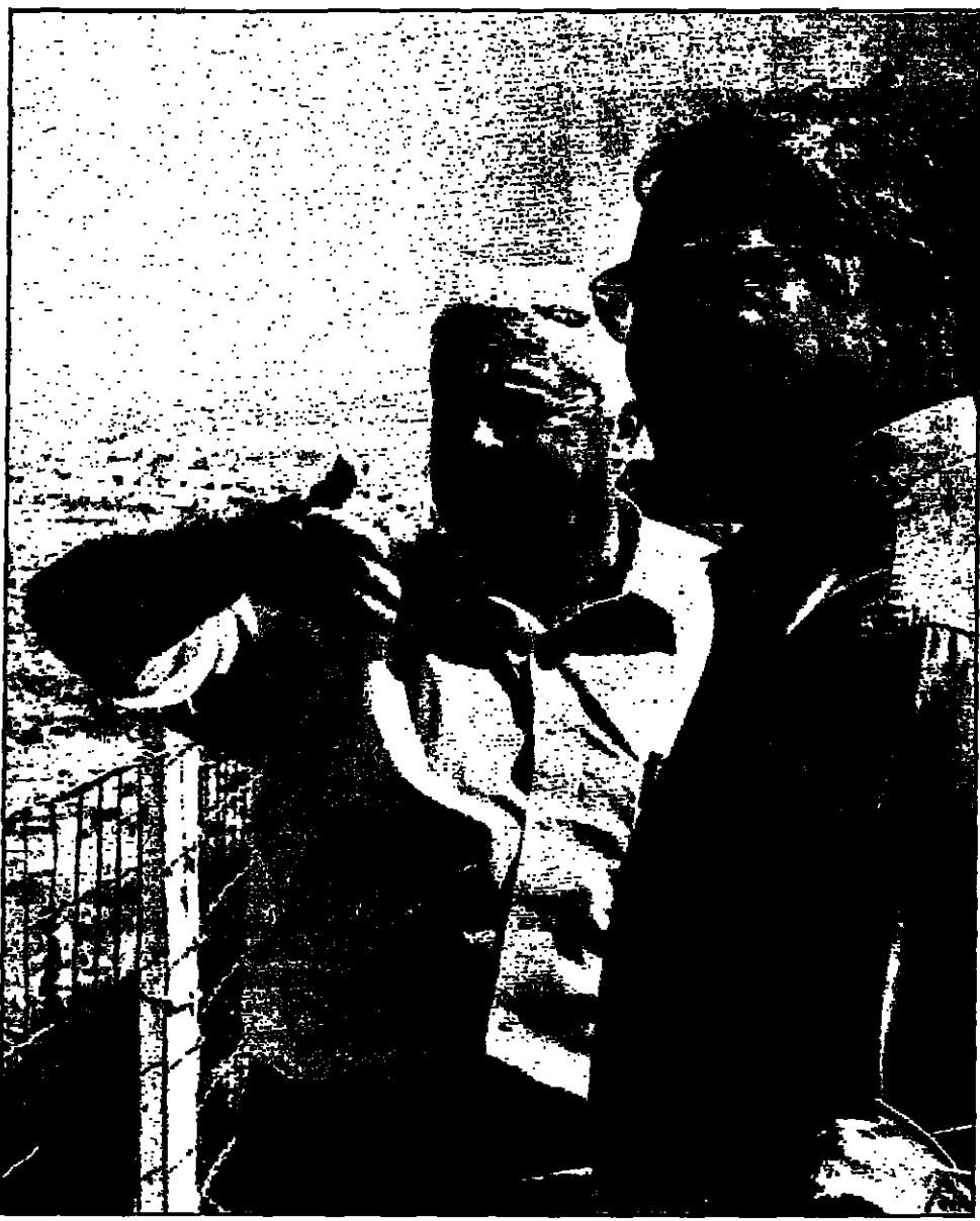
نتنياهو وشارون يتفقدان اسم ما سميته الواقع العسكرية في الضفة الغربية